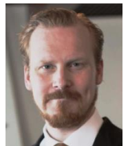
グスタフ・ストランデル Gustav Strandel